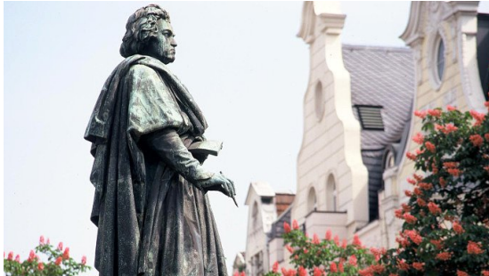
Ludwig van Beethoven