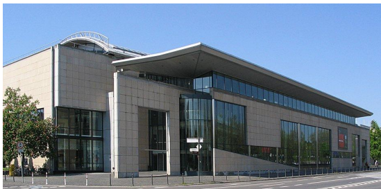
Projekt: Haus der Geschichte, Mülheimer Platz Bauherr: Stiftung Haus der Geschichte Architekt: Hartmut Rüdiger und Ingeborg Rüdiger