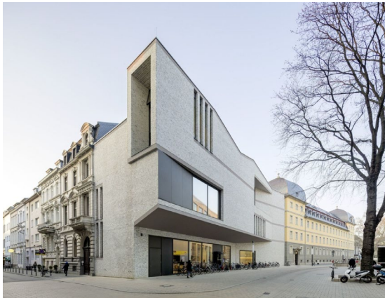
Projekt: Haus der Bildung, Mülheimer Platz Bauherr: Städtisches Gebäudemanagement Bonn Architekt: kleyer.koblitz.letzel.freivogel Gesellschaft von Architekten mbH